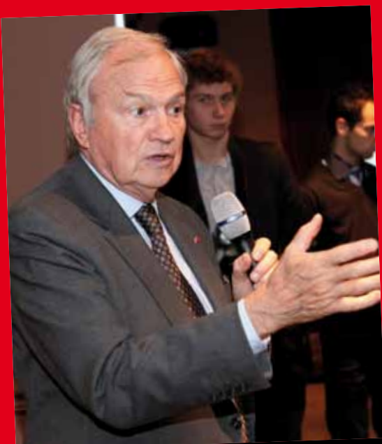
Claude Bébéar, Président d'honneur (Groupe AXA)